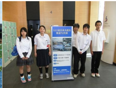
東北大震災報道写真展（※1）